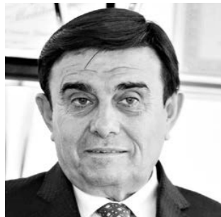
Akademik Prof. Dr. Anastas Angjeli

Profesor në fushën e ekonomisë dhe të financës, me një kontribut të shquar, veçanërisht në atë të financave publike dhe të reformave strukturore në ekonomi. Prej vitit 1982 e më pas ka kontribuar në profesorat e Fakultetit të Ekonomisë së Universitetit të Tiranës e më tej, pas vitit 1990 me angazhimet e tij në politikë. Deputet i Kuvendit të Shqipërisë për disa mandate që nga 1991 në vazhdim, Ministër i Ekonomisë, Ministër i Financave dhe Ministër i Punës dhe të Çështjeve Sociale. Prof. Dr. Angjeli është themeluesi i Universitetit Mesdhetar të Shqipërisë, anëtar i Akademisë së Shkencave të Republikës së Shqipërisë dhe anëtar i Akademisë Europiane të Shkencave dhe Arteve. Është afirmuar si një nga ekonomistët më të shquar, veçanërisht në aplikimin e reformave të ekonomisë së tregut në Shqipëri. Kontributi i tij i veçantë për reformën buxhetore e fiskale, për zhvillimin e sistemit financiar (bankar dhe jo bankar), për zbatimin e politikave fiskale në dobi të zhvillimit të biznesit dhe të investimeve vendase e të huaja në Shqipëri, për zhvillim-